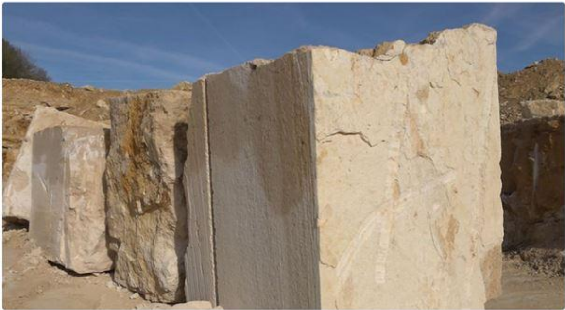
De gros blocs de pierres sont nécessaires à la restauration de l'édifice. ● © Y. Dorion - France 3 Paris Ile-de-France

Pour Notre-Dame, seule une carrière, celle de La Croix-Huyart, située à Bonneuil-en-Valois dans l'Oise, a répondu à toutes les exigences : "La spécificité de cette carrière, c'est aussi de pouvoir sortir des gros blocs. D'autres carrières, dans les mêmes terrains géologiques, il y en a 8 autres dans l'Oise et dans l'Aisne, mais ce sont des pierres plus tendres", indique David Dessandier du Bureau de recherches géologiques et minières (BRGM).